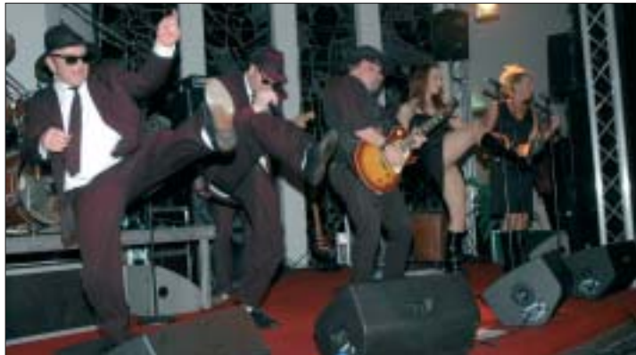
Soultrain: „Die authentischsten Blues Brothers Europas!“ live im Kulturzentrum Ofenerdiek.

Die 20-jährige Bühnenerfahrung von Soultrain mit tausenden von Auftritten garantiert einen tollen und unvergesslichen Abend. Bei Titeln wie „Everybody Needs Somebody“, „Soul Man“, „Sweet Home Chicago“ und anderen Soul Klassikern geht garantiert die Post ab. Ein besonderes Merkmal von Soultrain sind die unzähligen filmbezogenen Tanz-, Show- und Actioneinlagen auf der Bühne, bei denen kein Fuß ruhig und kein Publikum auf den Sitzen bleibt. Jake´s Steptanz auf dem Piano zum Beispiel, sein obligatorischer Flick Flack, Kunststücke mit der Peitsche oder Elwood´s Toastbrot-Weitwurf-Wettbewerb. Lassen Sie sich überraschen. Übrigens sind die beiden Hauptdarsteller Vater und Sohn. Joe alias Jake Blues hat schon in den 60er Jahren mit Musikern wie Tony Ashton und