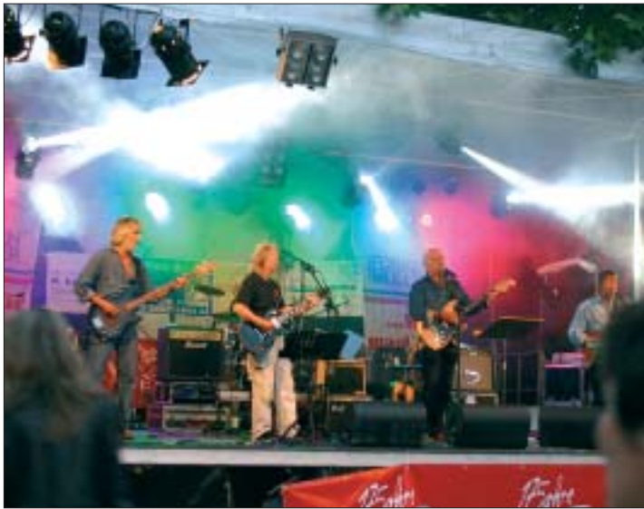
Die Gruppe „backstage“ sorgt für heiße Rhythmen.

Am Samstag, dem 31. Oktober erstrahlen die Beatsterne in Ofenerdiek