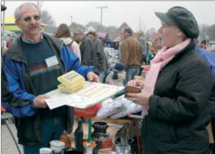
Reges Handeln und Feilschen herrscht auf dem Flohmarktgelände beim neukauf-Markt Am Stadtrand.

Der Bürger- und Gartenbauverein Ofenerdiek e.V. lädt am Sonntag, dem 27. September zum traditionellen Anwohnerflohmarkt auf dem Parkplatzgelände beim EDEKA neukauf-Markt Am Stadtrand ein.